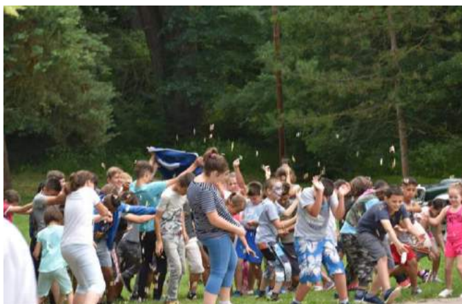
Ilyen még nem volt! Cukorágyúnak örültek a nebulók