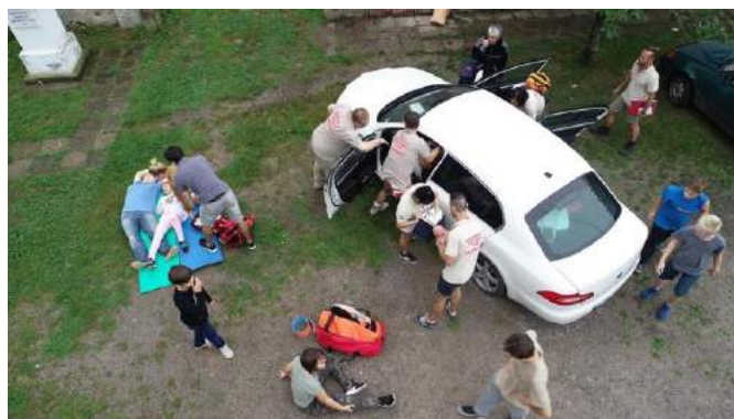
Drónfelvétel az egyik katasztrófavédelmi helyszínről