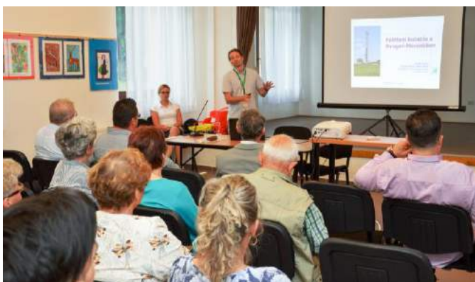
Részletes tájékoztatást adtak a szakemberek

A nyugat-mecseki tájékoztató társulás májusban rendezte meg a kétévente szokásos roadshow-t az NymTIT tagtelepülésein. Az ismeretterjesztő rendezvénysorozat célja ez alkalommal is az volt, hogy a nyugat-mecseki települések lakosai - a társuláson keresztül a nagyaktivitású hulladékok és kiégett fűtőelemek tervezett tárolójával kapcsolatos kutatások tényleges érintettjei - első kézből kapjanak információt a projekt céljáról, annak előrehaladtáról. A Bodán induló és Kóvágószőlősnön valamint Cserkúton végződő program tapasztalatai igen jók voltak, szinte minden alkalommal élénkérdeklődés fogadta az előadókat, és a legtöbb településen komoly érdeklődést tanúsítottak a lakosok.