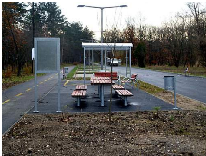
Kerékpárút és kerékpáros pihenő (illusztráció)

Bükkösdön kerékpárút és kerékpáros pihenő épül.