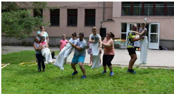
Együtt vetélkedett gyermek és szülő

Május 30-án, két helyszínen változatos programokkal várta a gyermekeket és családtagjaikat a bükkösi iskola. Családi sorversenyek, vízpisztoly csata, gyöngyfűzés, üvegfestés, légvár, trambulín, tűzoltó bemutató, gólyalábzás, erős ember bemutató, foci, kerékpáros ügyességi verseny, arcfestés, csillám-tetoválás, evőversenyek, táncbemutató, zsibvásár, rendőrségi bemutató, kosárfonás, polgárőr-vetélkedő, elsősegély-bemutató, légvár, cukorágyú, közös ebéd a szülőkkel, tombolahúzás értékes ajándékokkal – ez mind-mind a fergeteges családi és gyermeknap programjában szerepelt.