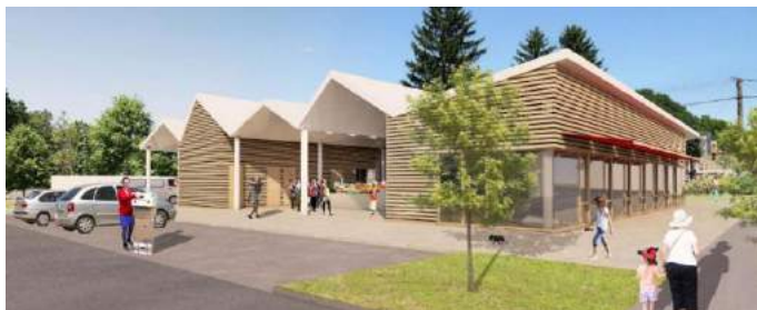
Fedett piactér (illusztráció)

A térségi gazdasági környezet fejlesztésére, a foglalkoztatás elősegítésére szánt keretből helyi gazdasági infrastruktúra fejlesztésére 17 projekt kapott 5.769 milliárd forintot. A nyertes települések: Bóly, Bükkösd, Cserdi, Harkány, Komló, Mohács, Pellérd, Sásd, Sellye, Szászvár, Szentlőrinc, Vajszló.