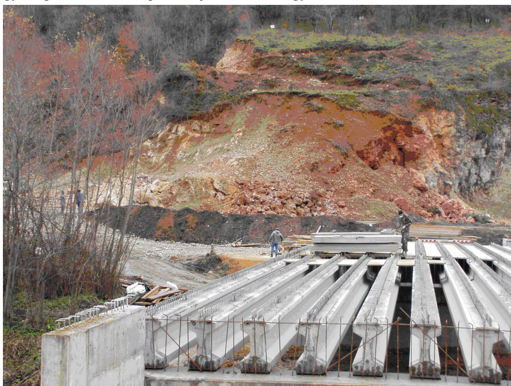
Az épülő híd 2007 decemberében

Bányakapitánysághoz benyújtotta engedélyezésre . Ezen engedélyezett bontási terv birtokában megkezdte a berendezések bontását és a komlói bányüzembe történő átszállítását.