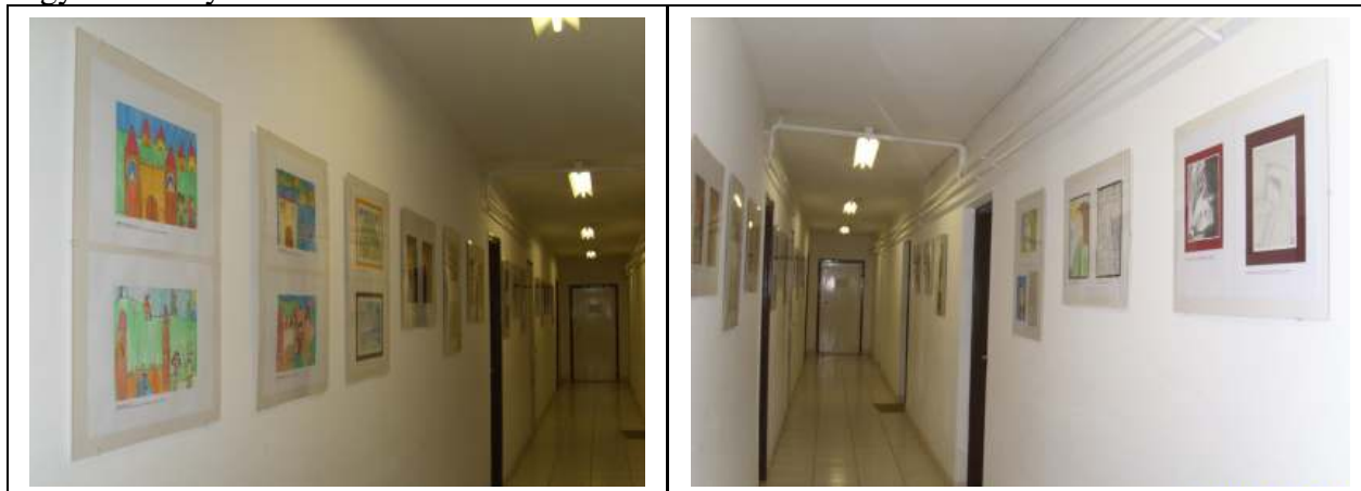
◀ Kiállítás az iskola folyosóján

December 20-án a kistérségi rajzpályázat legszebb alkotásaiból rendezett kiállítással megnyílt a képzőművészeti műhely kiállítótere az iskola könyvtárhoz vezető folyosón. A folyosógaléria közel ötven gyermekrajz vagy -festmény bemutatására alkalmas kiállítófelülettel rendelkezik.