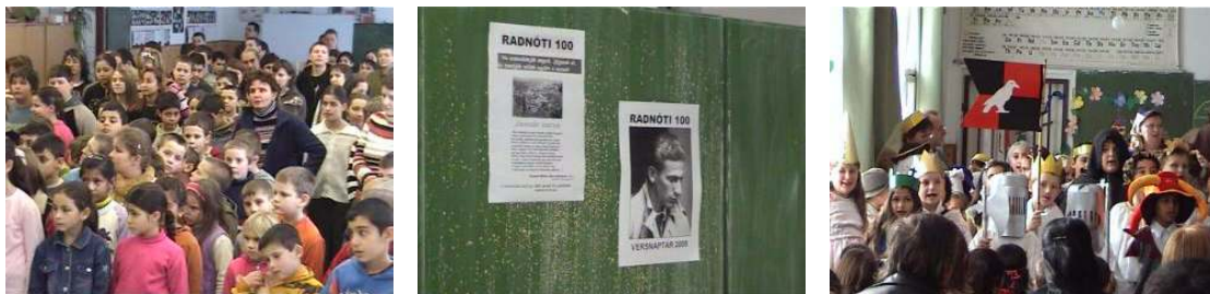
Az első Radnóti vers a Nem tudhatom 1-12. sora volt, a második a Tél című vers

Január 29-én vette kezdetét az iskolában az a megemlékezés-sorozat, amellyel Radnóti Miklós születésének 100. évfordulójára emlékezünk. Valamennyi diák és pedagógus minden hónapban megtanul egy-egy verset, melyet közösen előadnak az iskolában vagy egy-egy település közterén, középületében. Az első verset január 29-én, a másodikat február 13-án mondták el a gyerekek.