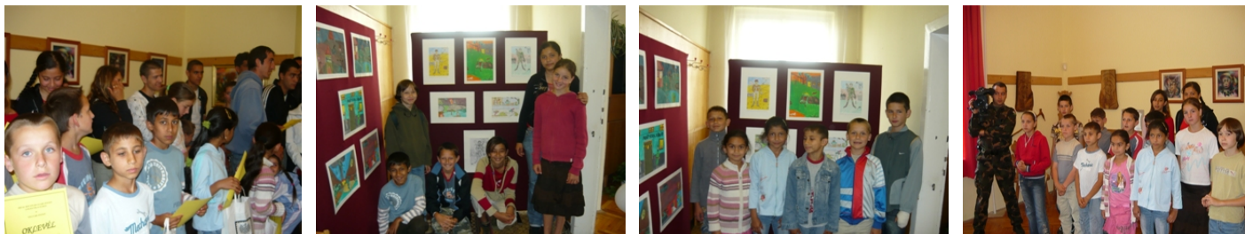
KÖZÖS KISTÉRSÉGI PEDAGÓGUSNAP SZENTLŐRINCEN