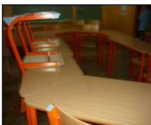
műhely az iskola padlásterében.

● Októberre elkészült egy 15 fő foglalkoztatására alkalmas képzőművészeti műhely, februárra pedig egy kézműves