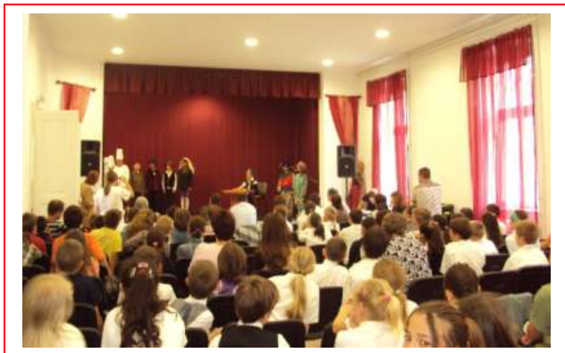
Színpadon a 3. osztályosok