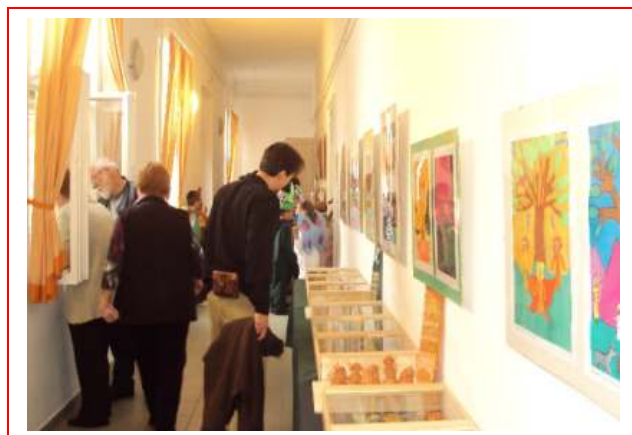
A bükkösi gyerekek kiállítása a szentlőrinci Művelődési Házban