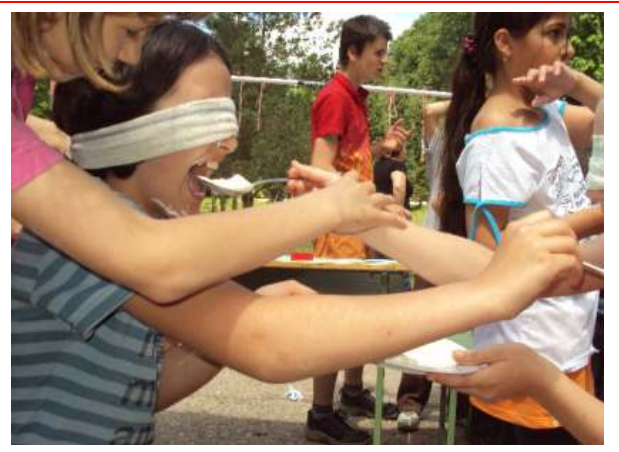
Vices etető és evőversenyek