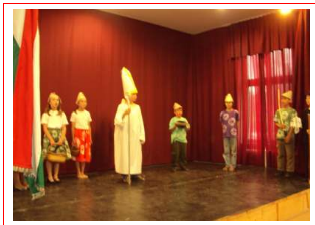
Színpadon a 4. osztályosok