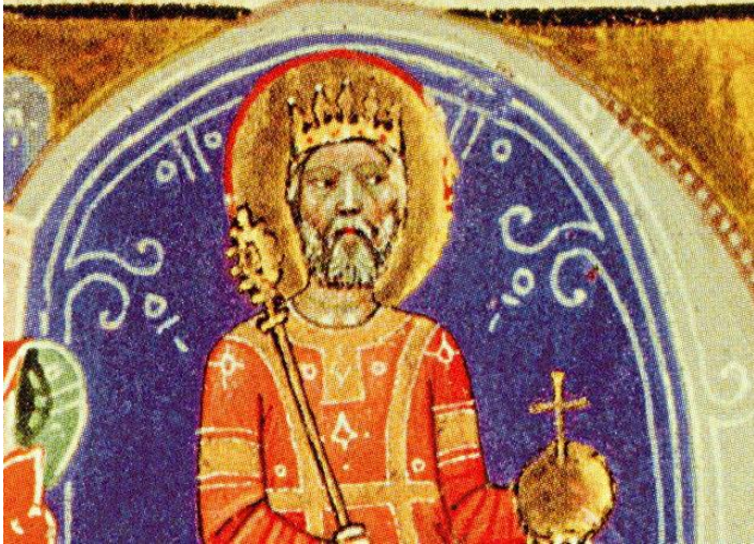
Szent István király a trónon a koronázási jelvényekkel. A Képes krónika miniatúrája

Augusztus 20. az egyik legrégebb magyar ünnepnap: Szent István király napja, a keresztény magyar államalapítás, a magyar állam ezeréves folytonosságának emléknapja.