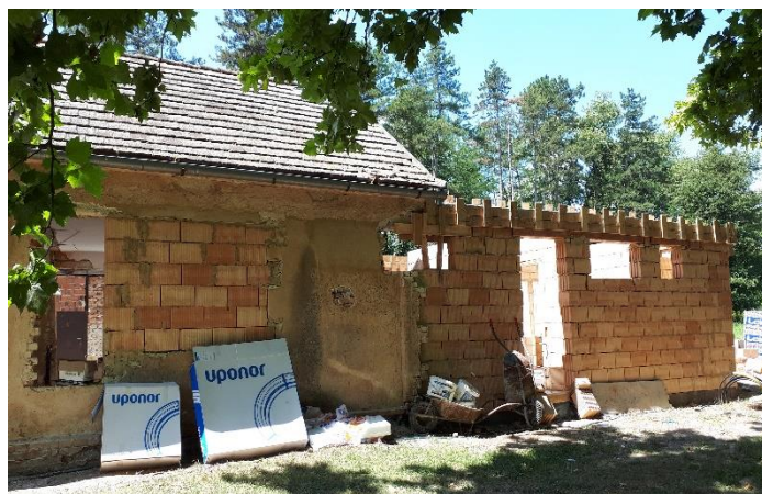
Már állnak az új ebédlő és tálalókonyha falai az iskolaudvarban

A Bükkösd Holnapjéért Egyesület nyertes pályázatával az általános iskolai tálalókonyhát és ebédlőt fejlesztik. Mire a gyerekek szeptemberben visszatérnek az iskolába, egy modernebb étkező várja majd őket.