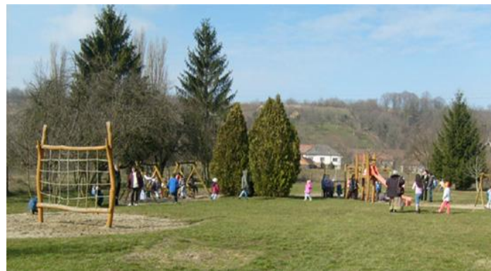
A bükkösi óvoda udvara

A bükkösi bölcsőde vázlatterve (alaprajza)