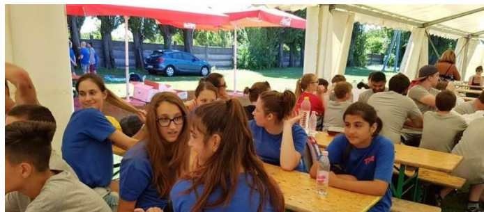
A „ Tanítsunk Magyarországot! ” program nyitórendezvényén

Az iskola a Pécsi Tudományegyetem pilot, azaz kipróbáló intézménye lesz a „ Tanítsunk Magyarországot! ” országos programnak, melynek célja, hogy az egyetemisták megmutassák a nehezebb helyzetben lévő gyerekeknek a településükön túli világ izgalmait és lehetőségeit (állatkeret, múzeumot, középiskolákat), hogy lássák, mennyi mindent tartogathat számukra a jövő. Az iskola 7. osztályosai június 28-án részt vettek a program nyitórendezvényén.