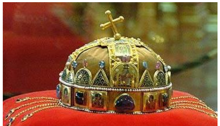
A Szent Korona

A két világháború között az ünnepelés kiegészült az összemzeti célkitűzésre, a Szent István -i (Trianon előtti) Magyarország visszaállítására való folyamatos emlékeztetéssel. Augusztus 20. 1945-ig nemzeti ünnep volt, ezután ezt eltörölték, de egyházi ünnepként még 1947-ig ünnepelheték nyilvánosan. István ereklyéjét a Szent Koronával együtt a második világháború végén a nyilasok Nyugatra szállították. A Szent Jobbot 1945. augusztus 18-án hozták vissza Ausztriából Budapestre, és 1947-ig ismét szereplője volt a Szent István -napi ünnepnek. (A Szent Korona csak 1978-ban került vissza az Egyesült Államokból.)