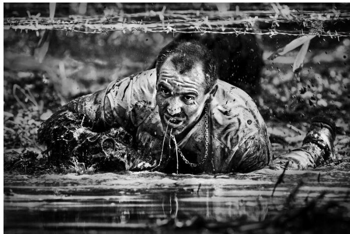
Kiss Imre: Bivaly Racing (2018)

Az alábbi fotó a tavalyi Bivaly Racingon készült. Kiss Imre alkotása 2. díjat nyert az Év Magyar Fotója 2018-as pályázatán a „Sajtófotó” kategóriában.