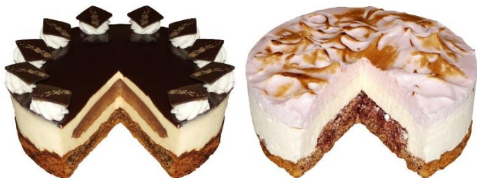
Az ország tortája és cukormentes tortája 2018-ban a „Komáromi kisleány” és a „Három kívánság” fantáziavű torta volt

Augusztus 20-án a hivatalos ünneplés Budapesten, a Kossuth téren Magyarország lobogójának felvonásával és a tisztavatással kezdődik. Ilyenkor Budán rendezik meg a mesterségek ünnepét, és ott mutatják be Magyarország tortáját Bár délután a Szent István-bazilika körüli Szent Jobb-körmeneten részt vesznek a közjogi méltóságok is, az eseményen elsősorban a hívők tisztelegnek Magyarország fővédőszenjtje előtt. Az ünnepnapot az esti tűzijáték zárja.