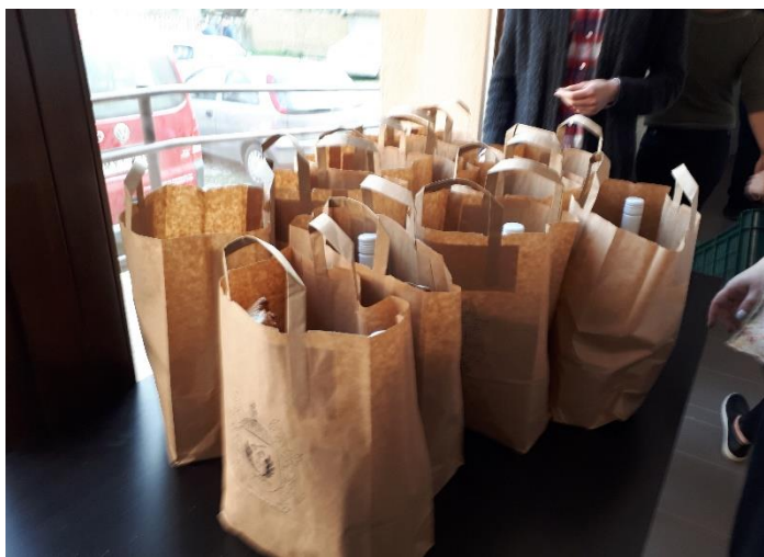
Az egyik előadás és az ajándékok a szabadegyetem márciusi rendezvényén