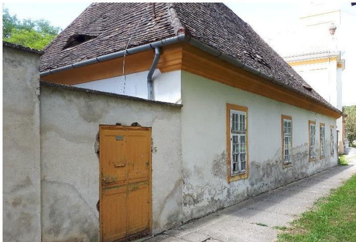
Felújításra váró járdaszakasz a Parókia előtt