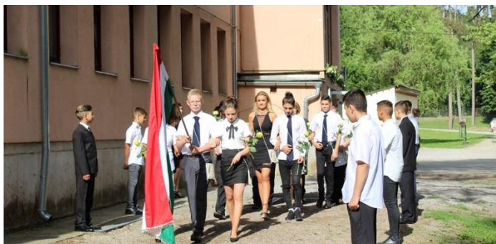
Elballagtak a 8. osztályosok

Június 15-én ballagással, tanévzáró ünnepélyel és bizonyítványosztással fejeződött be a 2018-2019-es tanév az iskolában.