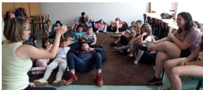
Játékos vetélkedő a nyári napköziben

A tanévzárást követő héten nyitotta meg kapuit a nyári napközis tábor az iskolában. A gyerekek színvonalas és élménydús programok részesei voltak a hét minden napján.