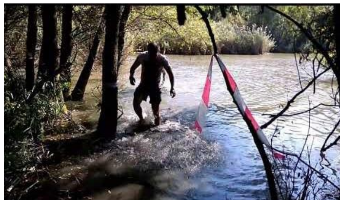
Átkelés a: Bivaly Racing egyik vizes akadályán 2018-ban