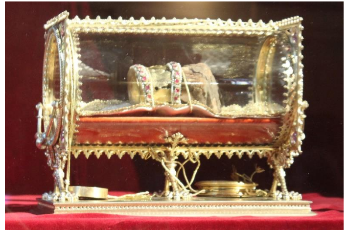
A Szent Jobb ezüstből és csiszolt üvegből készített neogótikus ereklyetartója

Az 1848-as szabadságharc leverése után hosszú ideig nem tarthatták meg a nemzeti ünnepet, hiszen Szent István a független magyar állam szimbóluma volt. Először 1860-ban ünnepelheték meg a napot, amely országszerte nemzeti tüntetéssé vált. Az 1867-es kiegyezést követően az ünnep visszanyerte régi fényét, majd 1891-ben Ferenc József az ipari munkások számára is munkaszüneti nappá nyilvánította, 1895-ben pedig a belügyminiszter elrendelte a középületek felloboogozását címeres zászlóval.