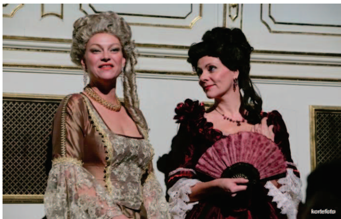
Jelenet a Veszedelmes viszonyok című előadásból

A pályázat keretében egy nyolcfős kulturszakkör is megkezdte működését. A tagok évente 12 alkalommal vesznek részt különböző kulturális rendezvényeken (színházi előadáson, felolvasóesten, hangversenyeken). Márciusban a Pécsi Nemzeti Színházban tekintették meg a Veszedelmes viszonyok című előadást.