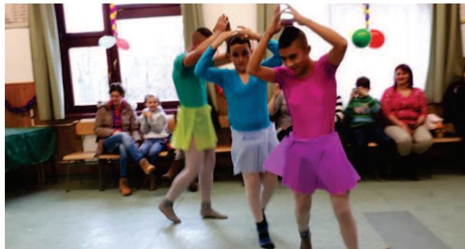
Hattyúk tánca a felsős farsangon

A Bükkösi Önkormányzat, a Bükkösi Német Önkormányzat és az Esthajnal Nyugdíjas Klub – szintén az EFOP 1.3.5-16 pályázat támogatásával – nyugdíjas bált rendezett február 17-én. Az Esthajnal Nyugdíjas Klub számos nyugdíjas szervezetet hívott meg a térségről erre a farsangi rendezvényre. Az esten – mely a Sportcsarnokban került megrendezésre – sváb zene szólt, s fellépett többek között a Magyarhertelendi Bortal Kör és az Esthajnal Nyugdíjas Klub énekkara.