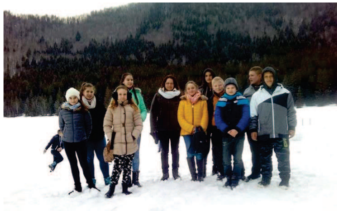
A Szent Anna-tónál

A bükkösi iskola tíz tanulója erdélyi tanulmányi kiránduláson vett részt március 25-től 28-ig három másik iskola (Szabadszentkirály, Bicsérd és Drávasztára) felső tagozatos diákjaival együtt. Tartalmas programjukról részletes beszámoló készül, melyet az iskolában meg lehet majd tekinteni.