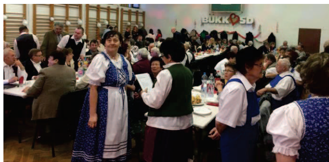
Jelenet a nyugdíjasok báljából

A Bükkösi Önkormányzat, a Bükkösi Német Önkormányzat és az Esthajnal Nyugdíjas Klub – szintén az EFOP 1.3.5-16 pályázat támogatásával – nyugdíjas bált rendezett február 17-én. Az Esthajnal Nyugdíjas Klub számos nyugdíjas szervezetet hívott meg a térségről erre a farsangi rendezvényre. Az esten – mely a Sportcsarnokban került megrendezésre – sváb zene szólt, s fellépett többek között a Magyarhertelendi Bortal Kör és az Esthajnal Nyugdíjas Klub énekkara.