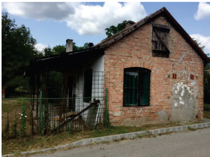
Az egykori pálinkafőző lerobbant épülete

Az adóemelések és az otthoni (házi) pálinkafőzések elterjedése miatt már nem volt rentábilis a pálinkafőzde működtetése Bükkösdön. A létesítményt a Bükkösi Önkormányzat nem tudta tovább üzemeltetni. Ezért a képviselőtestület döntött a létesítmény felújításáról és új funkcióval történő ellátásáról.