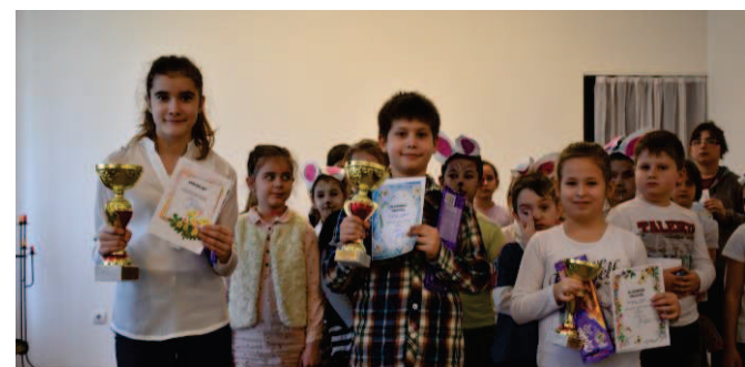
A szavalóverseny győztesei

Március 27-é és 28-án – szintén két helyszínen – került megrendezésre az iskolások nyúlnapi kézműves foglalkozása és az alsó tagozatosok tavaszi versmondó versenye. A foglalkozásokon felhasznált anyagokat, eszközöket, valamint a versmondó verseny jutalmait szintén az EFOP 1.3.5-16 pályázat támogatta.