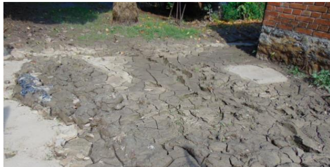
„Füves udvar” az áradás után

Mégis az Önkormányzat azonnal közbelépett. A polgármester átirányította az árkoló gépet a veszélyeztetett árok szakaszra, hogy megelőzzék az újabb veszélyt. Mert a vészhelyzet elhárítása viszont az Önkormányzat feladata, mint minden más településen, a hosszú távú árokrendezés pedig a Vízügyé .