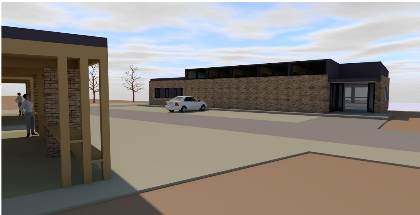
A bükkösd piactér és az élelmiszerüzlet látványterve

A piactér kiépítése mellett egy 200 m 2 alapterületű, jól felszerelt, modern élelmiszerüzlet is szerepel a megvalósítandó pályázat létesítményei között, amely nemcsak Bükkösd, de a környező települések lakói számára is magas színvonalú ellátást fog biztosítani.