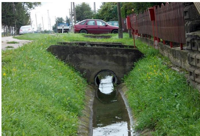
Az átereszek karbantartása a háztulajdonosok feladata

Ahhoz, hogy a falu vízvezető rendszere hatékonyan működjön nemcsak az Önkormányzatnak, de az egyes porták tulajdonosainak is van feladatuk. Az árokásó gép tisztítja, mélyíti a medret, de a házak előtti hidak alól nem tudja elkotorni az ott felgyülemlt hordalékot, szemetet. A bejáró hidak aljának, az áteresznek a tisztítása a háztulajdonosok feladata. A Közút csak azzal a feltétellel adott ki engedélyt a hídépítésre, ha az érintett tulajdonos vállalja annak karbantartását.