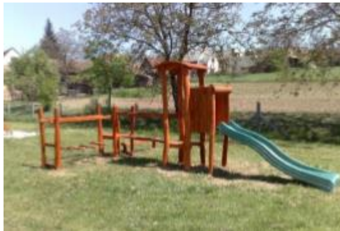
Ehhez hasonló új játékok kerülnek a játszóterekre

Augusztus végén, szeptember közepén megújulnak a település játszóterei. A Templom térre és a Petőfi utcába vadonatúj játszótéri játékok, kerti padok, szeméttárolók kerülnek mintegy 5 millió forint értékben – mondja Budai Zsolt polgármester. Mindegyik játék megfelel az uniós szabványoknak. Az új létesítményekkel felszerelt két játszótér mellett felújításra kerül a Hársfa utcai játszótér is.